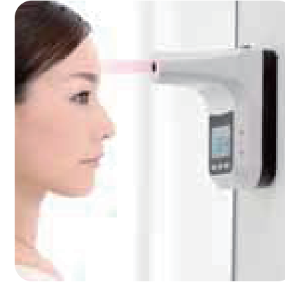
赤外線温度センサー非接触型 温度測定で日常的にチェック